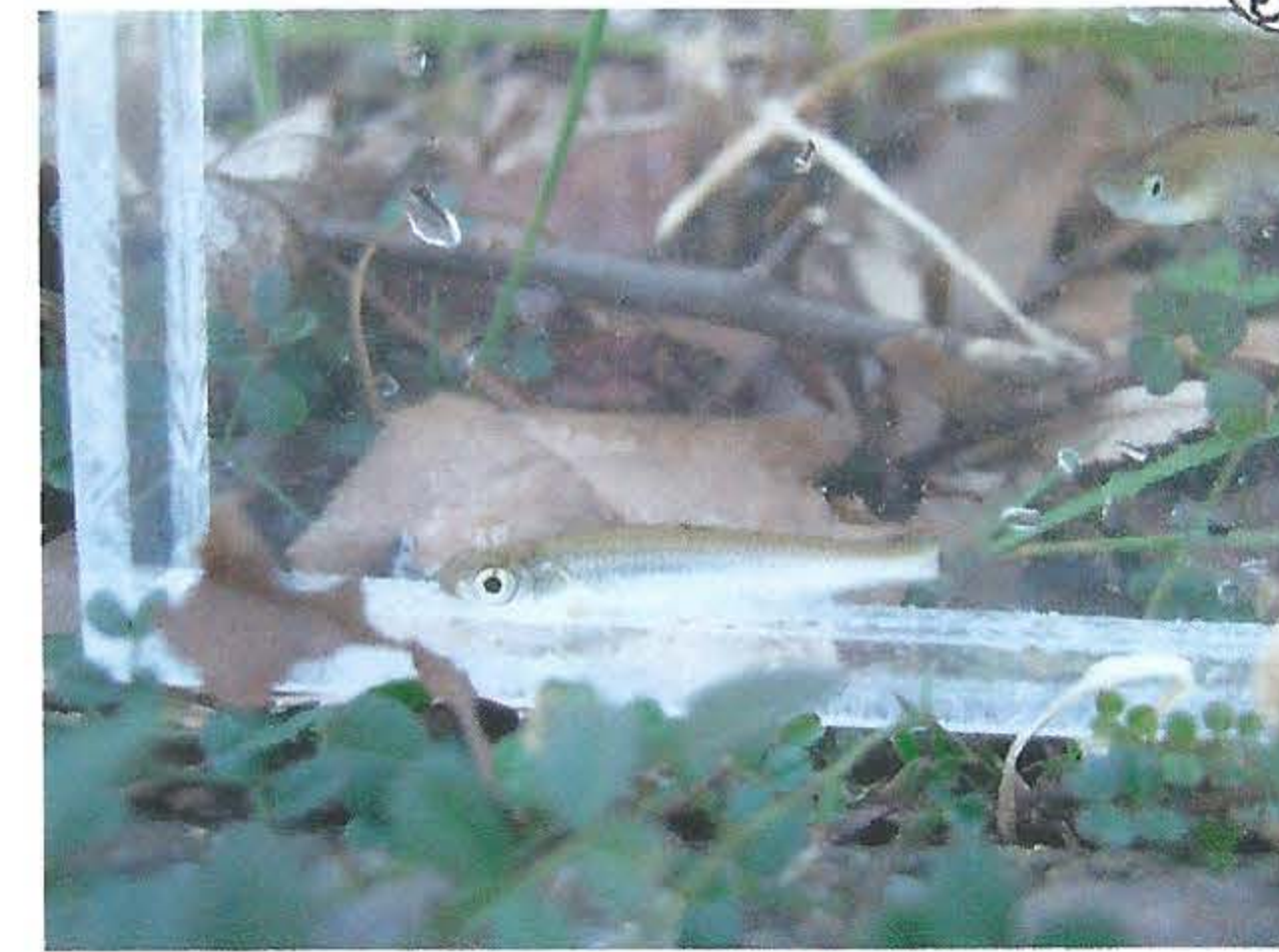
オイカワ(正面)とメダカ(右上)

2月16日(土)、冬の野川ガサガサを行いました。まずは階段の落ち葉を掃き、踊り場に積もった土砂を掻き出し、ずっと気になっていた散乱するごみの回収。工事の廃材なのか巨大な鉄板、衣類の山、空き缶の詰まった袋、何かの機械の一部と思われる物体、網、買い物かごなど、大量で2時間経過。続けて生きもの調査を30分ほど行いました。メダカ26、オイカワ2など、計5種類57匹の収穫、魚の群れも見えました。