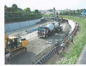
高水敷(川原)の高さは工事前と同じですが河床を深く掘り下げました