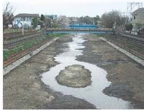
現場材料で水際に寄石・寄土、左右から湧水が出ています