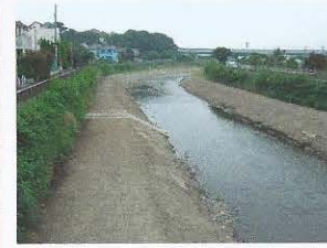
出来上りは河岸の勾配がきつく、水辺に近づきにくくなりました