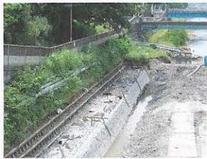
高水敷を下げることで河床掘削は少なく、護岸の根入れも浅くなりました