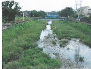
野川自身の自然の営みで復元し水生生物も早く回復しました