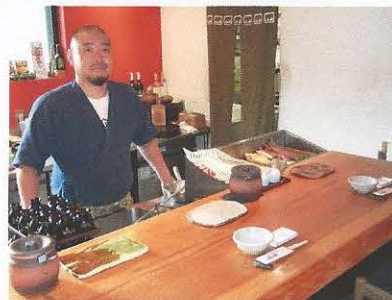
宇奈根 3-7-15、電話 3416-6620、日月休み

水道道路を挟み宇奈根地区会館の向かいの道を入ったところに黒いシックな建物があります。木の銘板には「宇奈根山中」、天ぷらと蕎麦の店です。