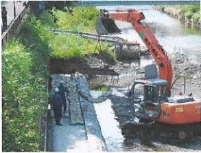
護岸には雑割石を積み、平場には自然石をはめています