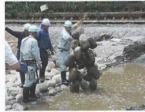
玉石を鎖でつなげたものを落差工の上流側に並べます