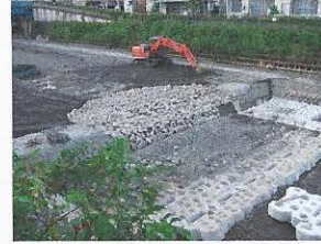
上流側は連結玉石、下流側には護床ブロックが入っています