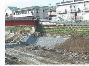
護岸はコンクリートブロック、土盛り、ブロックマット、さらに土盛りしました