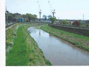
現在は草も生えましたが、川が自然に動けず直線的です