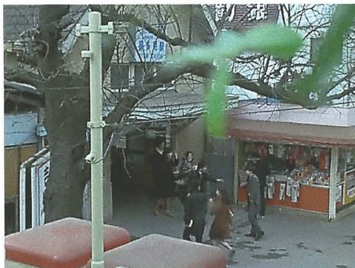
『怪奇大作戦』に登場する昔の喜多見駅

喜多見は映画やドラマで使われることがよくあります。今回は昭和のドラマの中から探してみました。現在、DVDとして販売されているドラマもあり、昔の風景を動画で楽しめそうです。