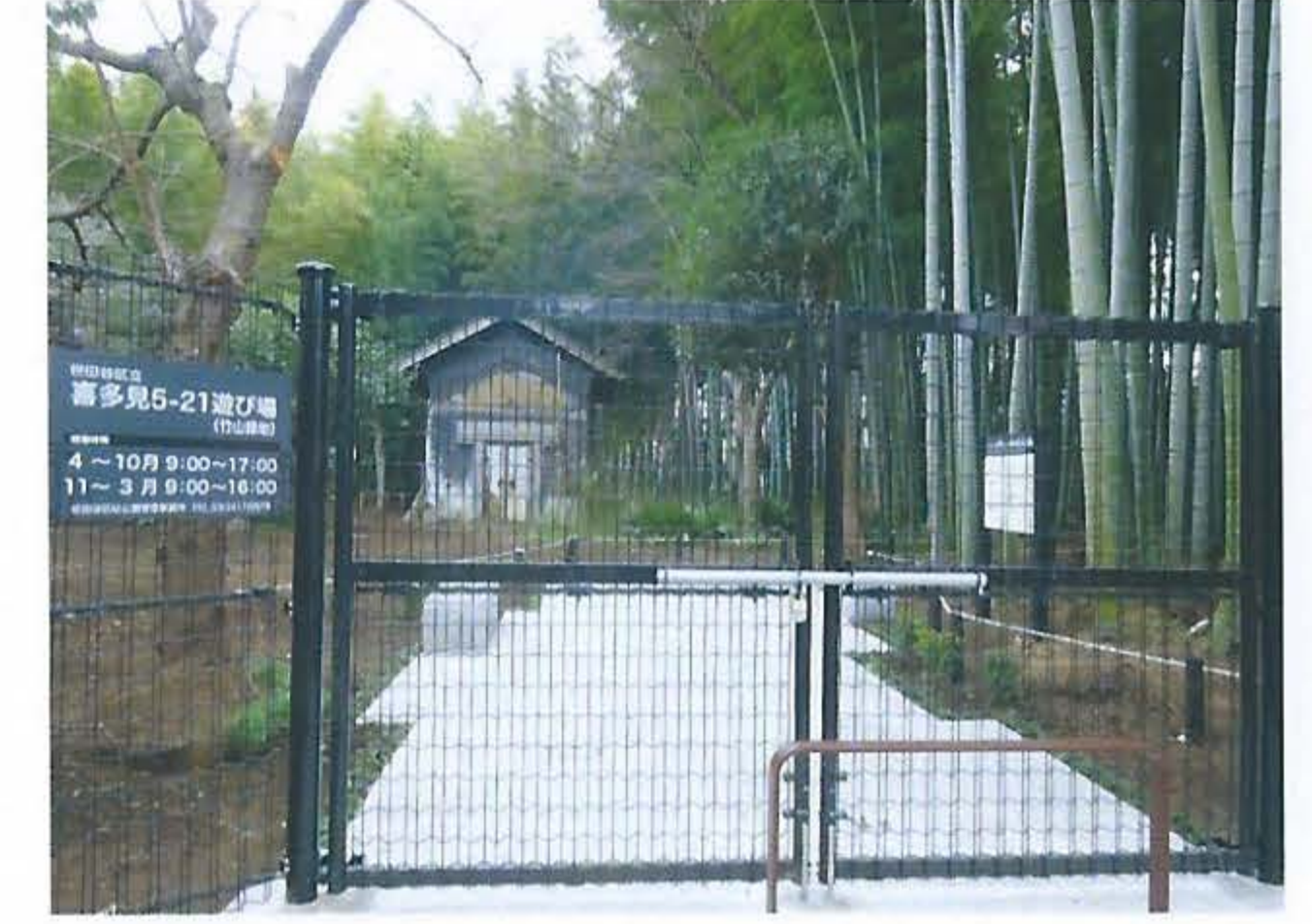
西側に新設された入口

「喜多見五丁目竹山市民緑地」は所有者から世田谷区に寄付され、2020年9月に「区立喜多見5-21遊び場」の一部となりました。さらに、2021年11月から整備工事が行われ、今年6月に「竹山緑地」としてリニューアルオープンする予定です。工事は可能な限り既存の緑地を保全するという方針で行われ、土蔵も風景の一部として溶け込んでいます。